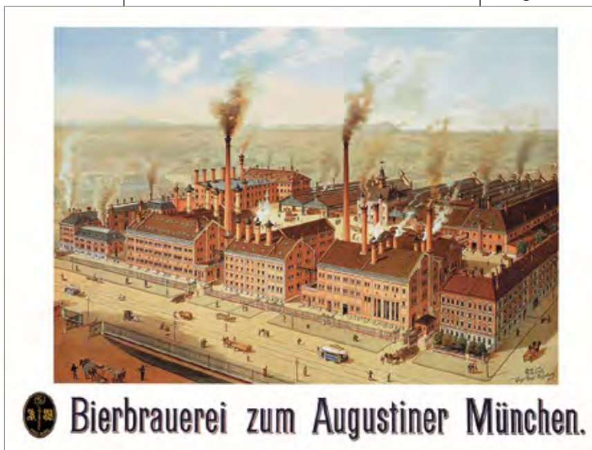
Augustiner Plakat 1885

2017 After a year of renovations, the traditional Nuremberg restaurant Augustiner Zur Schranke opens at the Tiergärtnerort. The building was probably built in 1545.