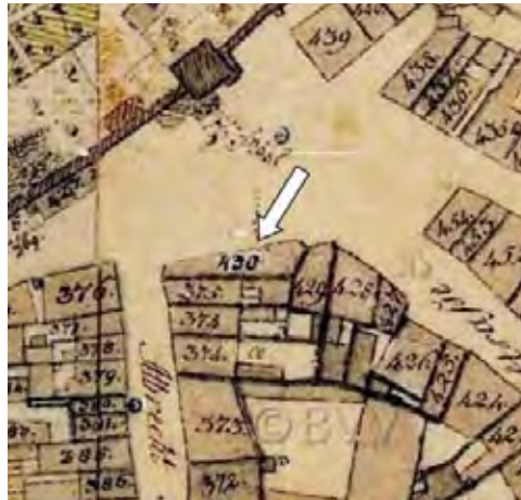
Site plan 16th century.