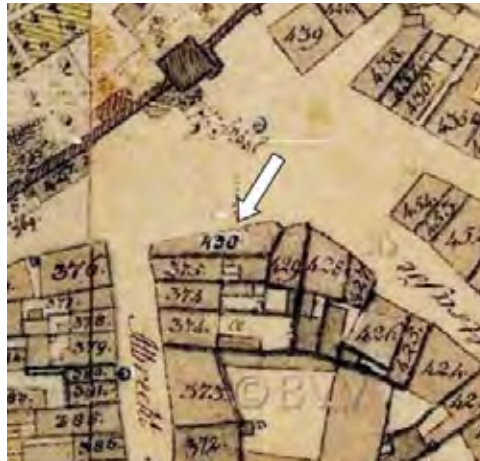
Lageplan 16. Jhd.

Kurzzeitig hieß die Gaststätte „Zum goldenen Rösslein“, ein Stich von J.A. Delsenbach aus dem Jahr 1714 belegt dies. Ab 1900 war dann die „Schranke“ eines der bekanntesten und beliebtesten Lokale der Stadt. Es war nicht der verheerende Bombenangriff vom 2. Januar 1945,